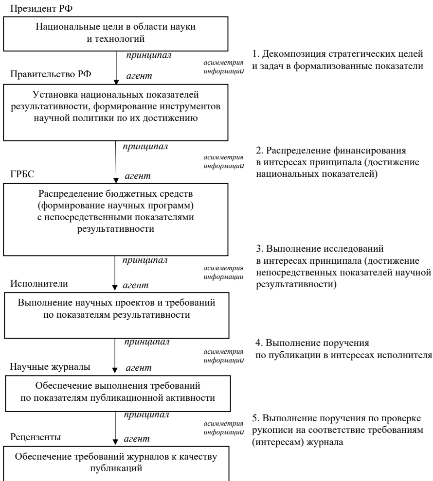
Рис. 3. Модель принципал-агентской проблемы в системе финансирования науки по результатам (на примере России)

Принимая во внимание вышеописанные доводы против тех или иных логических уязвимостей сложившихся позиций, можно составить модель принципал-агентской проблемы, максимально учитывающую административную конфигурацию систем финансирования науки по результатам. Пример такой модели (на примере России) представлен на рисунке 3.