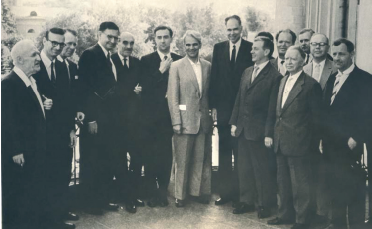
Рис. 1. И.Е. Тамм (крайний слева), Н.Н. Семёнов (5-й слева), М.В. Келдыш (в центре), Л.А. Арцимович (крайний справа) на мероприятии в АН СССР, 1960-е гг.