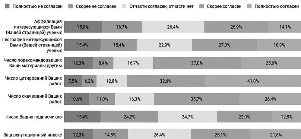
Рис. 4. Распределение ответов на вопрос: «Насколько Вы согласны с тем, что в академических интернет-сетях для Вас важны...»