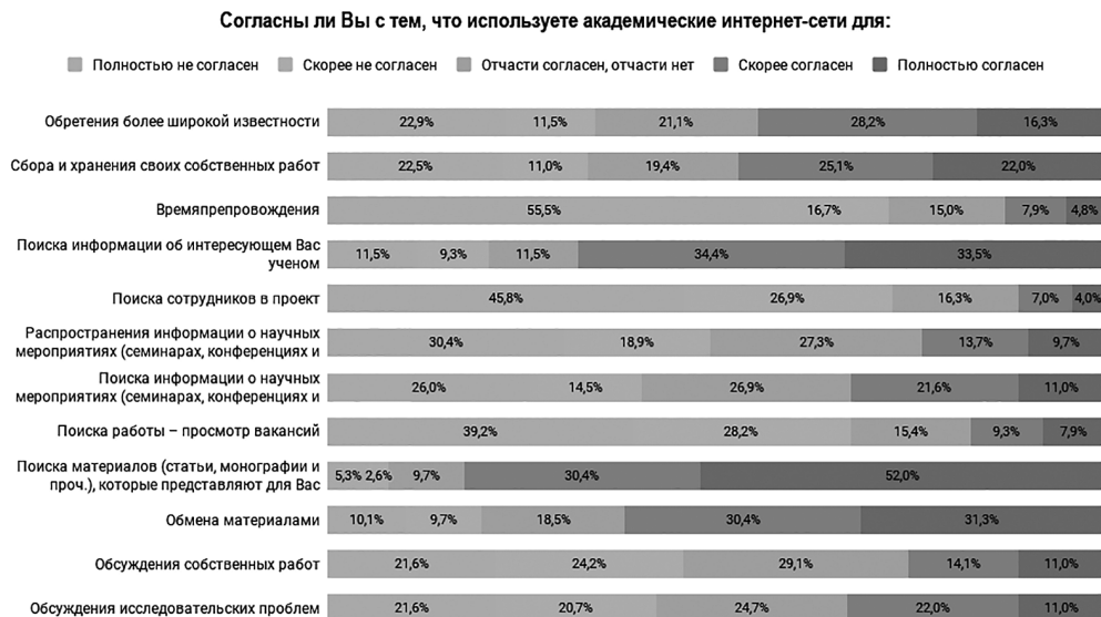
Рис. 2. Распределение ответов на вопрос: «Согласны ли Вы с тем, что используете академические интернет-сети для...»

ными процессы генерации нового знания, его распространения, оптимизирует хранение и извлечение материала из репозиторий [Bernius, 2010; Bernius and Hanauske, 2009; Houghton et al., 2009]. С. Берниус в своей работе воспользовался моделью SECI, описывающей четыре способа трансформации знания из «скрытого» в «явное»: социализация, экстернализация, комбинация и интернализация [Nonaka, 1994].