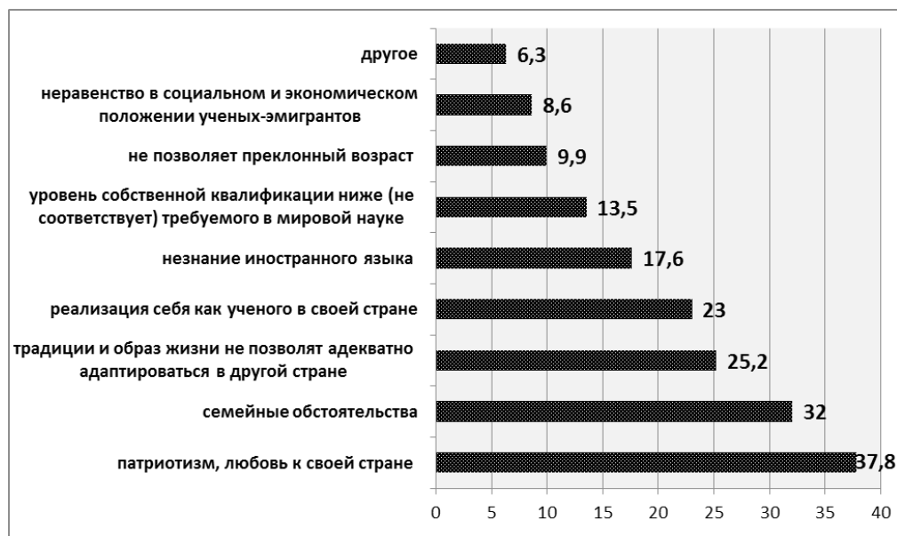
Рис. 2. Причины, удерживающие женщин-исследователей от эмиграции (в %, в целом по выборке)

Как видно из рисунка 2, пятерку причин, удерживающих от эмиграции женщин-исследователей, составили следующие: патриотизм, любовь к своей стране (37,8%), семейные обстоятельства (32%), боязнь, что личные привычки, традиции и образ жизни не позволят адекватно адаптироваться в другой стране (25,2%), реализация себя как ученого в своей стране (23%), незнание иностранного языка (17,6%), причем семейные обстоятельства расцениваются как помеха эмиграции для женщин-исследователей. Также среди причин стоит выделить несоответствие уровня собственной квалификации требуемому в мировой науке (13,5%). Для 9,9% женщин эмигрировать в другую страну не позволяет преклонный возраст. Лично оскорбляет неравенство в социальном и экономическом положении ученых-эмигрантов женщин и не желают быть человеком второго сорта 8,6% женщин. В варианте «другое», который выбрали 6,3% женщин, были такие ответы как: «мало опыта в избранной сфере»; «много усилий было приложено, чтобы наладить свою жизнь здесь»; «отсутствие средств»; «слишком «домашняя»; «не уверена, что «выживу» вдали от семьи».